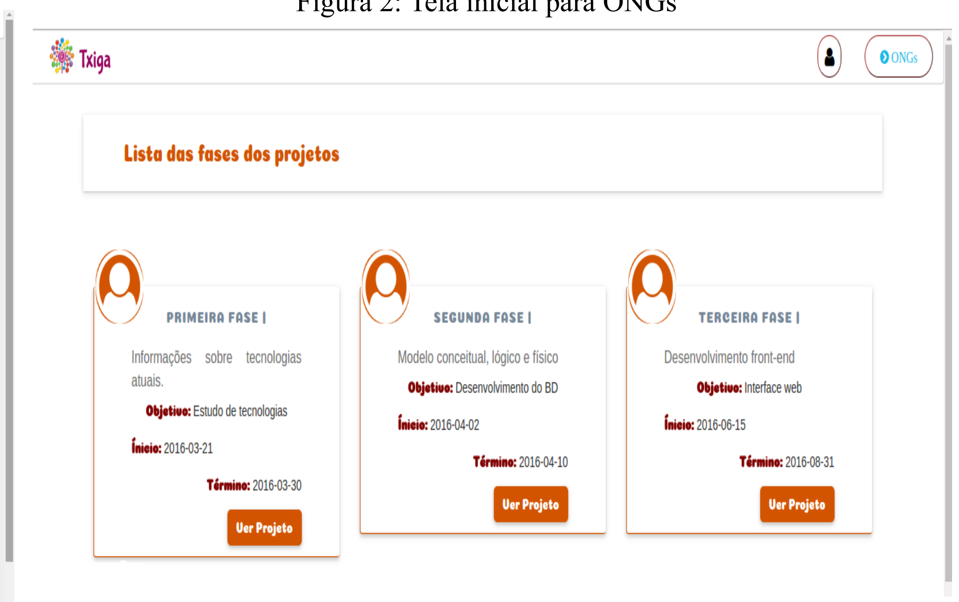
Figura 4: Tela da lista das fases dos projetos